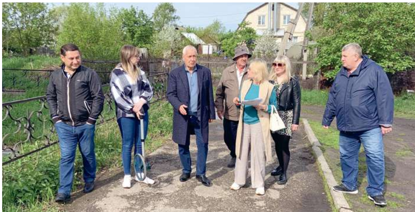
п. Исаково, ул. Дорожная, 1