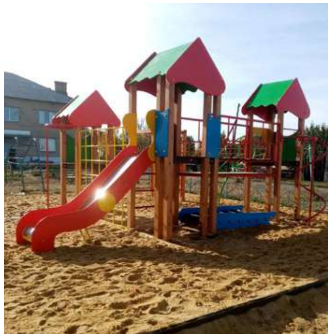
Работы по благоустройству в п. Исаково, ул. Дорожная, 1