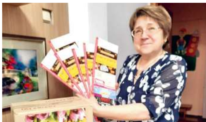
МБДОУ ДС №89