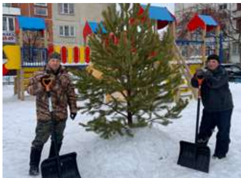
Пер. Дачный, 14Б