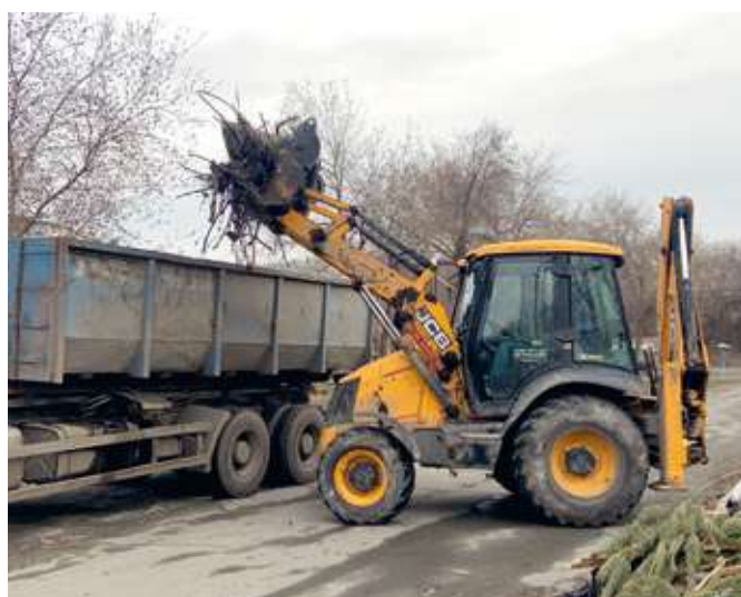
Работы на ул. Контейнерная п. Локомотивный