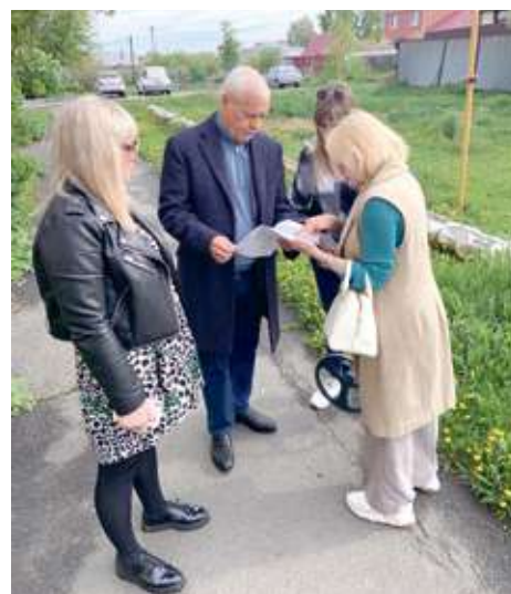
п. Смолино, ул. Фестивальная, 8