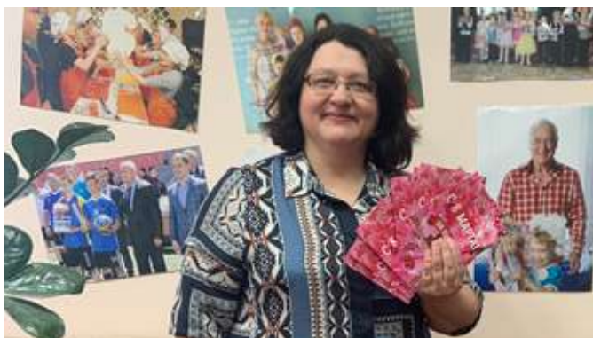
МБУ Центр «Надежда»