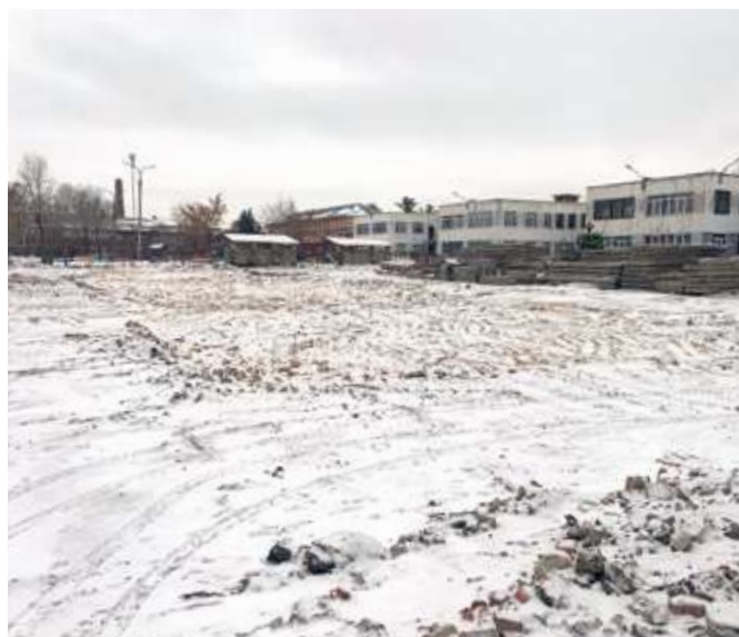
Работа выполнена точно в срок