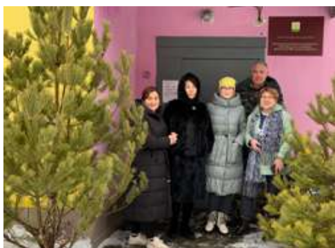
МБДОУ ДС 89