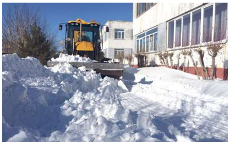
МБДОУ «ДС №446 г. Челябинска», п. Смолино