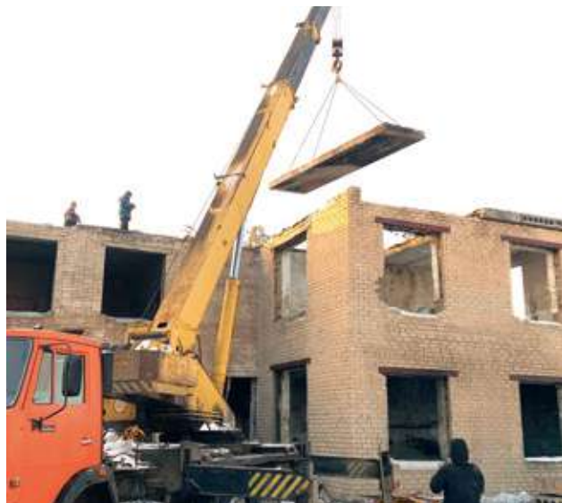
Встреча на месте проведения работ и общение с жителями