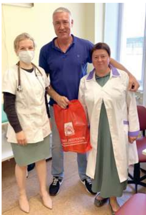
Филиал ДГКБ №7