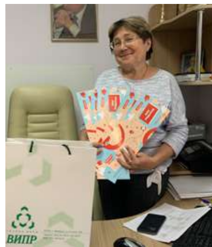
МБДОУ ДС №89 Т.Н.Шмельёва

«Развитие наших детей зависит от вашего профессионализма и мудрости. Ежедневно вы дарите дошколятам внимание, заботу и тепло. С вашей помощью они познают мир, учатся общению и жизни в обществе», – подчеркнул депутат.