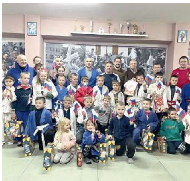
Юные спортсмены Донецкой республики