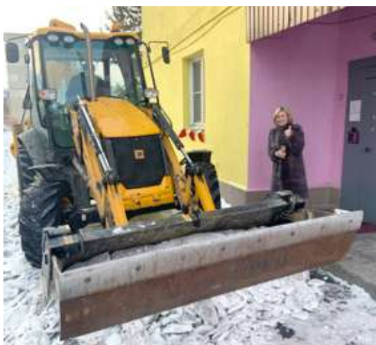
МБДОУ «ДС №89 г. Челябинска», п. Локомотивный

Также депутат помог и в уборке снега на территории социально значимых учреждений посёлка Смолино. Он предоставил технику и бригаду рабочих для уборки детского садика, школы, офиса врача общей практики и храма.