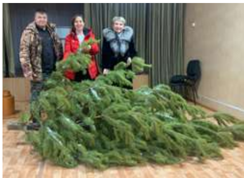
МАОУ СОШ №145 (филиал) п. Смолино