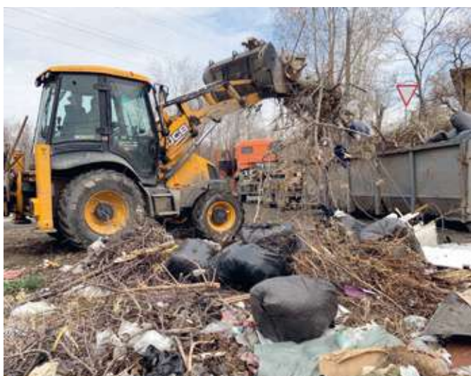
Уборка несанкционированных свалок п. Локомотивный