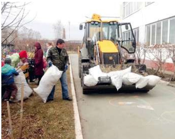
Помощь в уборке мусора на территории детского сада №446 в п. Смолино