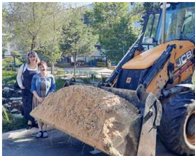
Доставка сертифицированного песка на детские площадки поселков округа