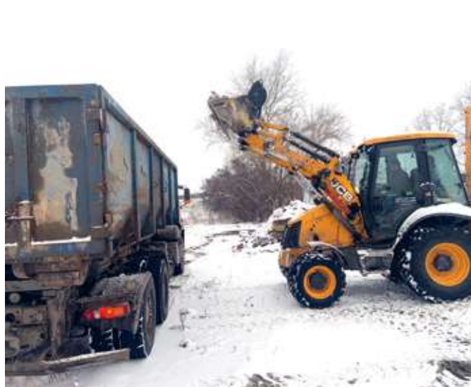
Результат от проделанной работы - чистый и опрятный въезд в город.

В работе на субботниках Виталий Павлович принимает личное участие и привлекает своих помощников.