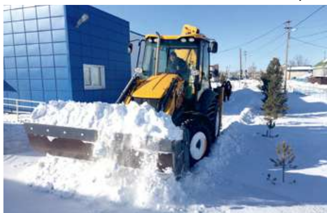
Отделение врача общей практики Городская поликлиника №1, п. Смолино