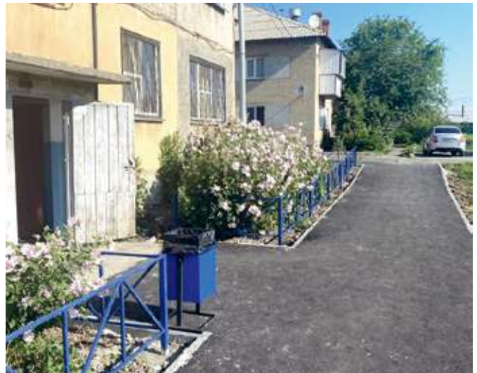
Работы по благоустройству в п. Смолино, ул. Фестивальная, 8