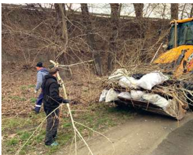
Работы на ул. Контейнерная п. Локомотивный