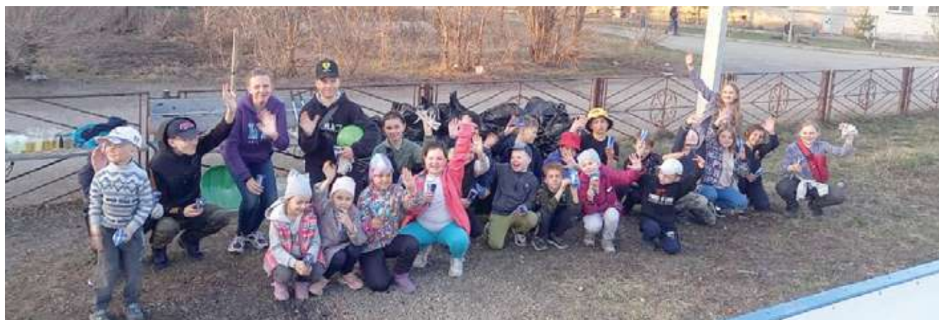
В п. Исаково юные спортсмены-дзюдоисты провели субботник около хоккейной коробки. После нелёгкого труда каждому юному спортсмену сладкий подарок от депутата