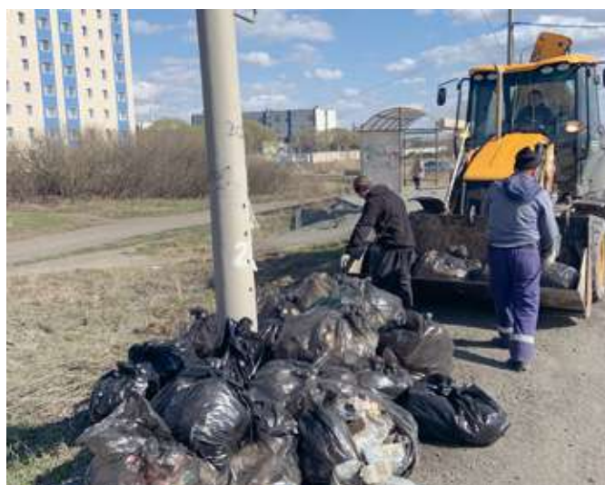
Уборка мусора вдоль дороги Меридиан

Всего на мусорный полигон отправлено более 210 м 3 мусора. Огромное спасибо всем, кто принял участие в субботнике!