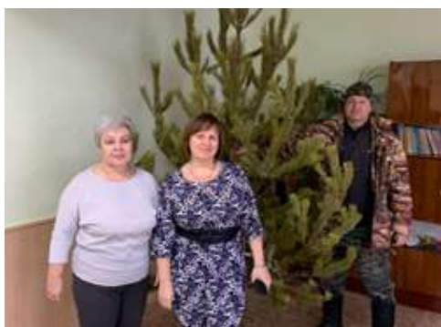
МАОУ СОШ №145 (филиал) п. Исаково